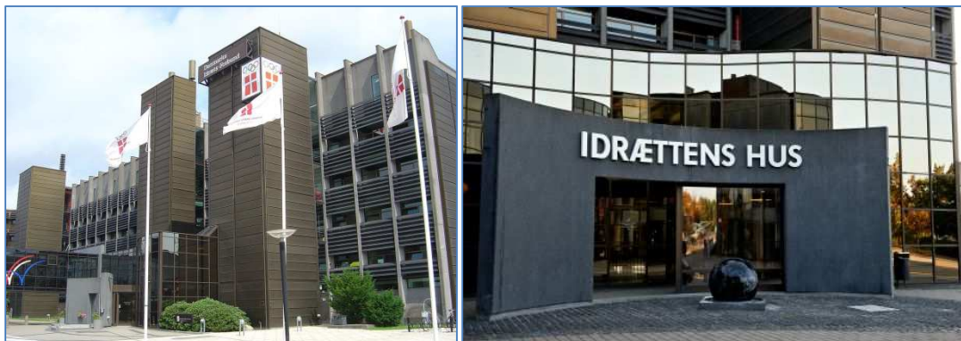
Dánsky dom športu v Brøndby, zhruba 10 km západne od centra Kodane